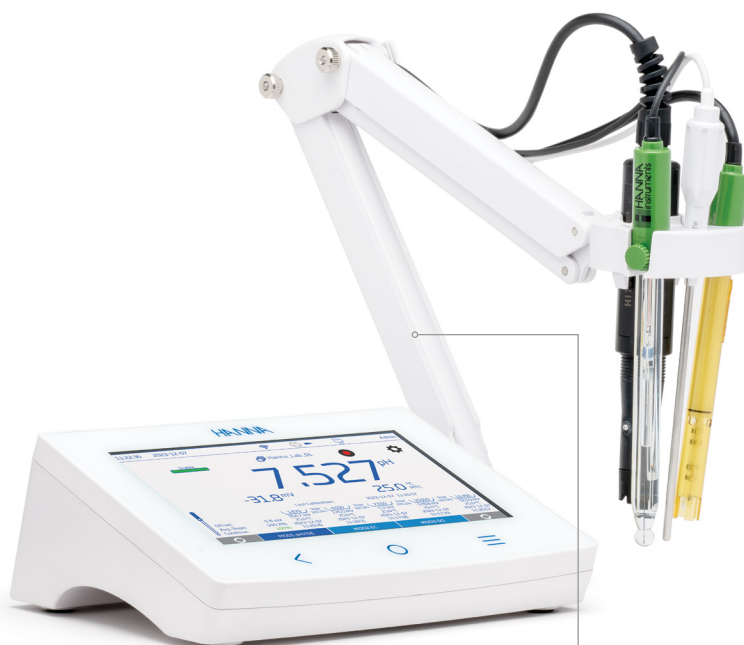
Support d'électrode avec bras flexible inclus (installation de chaque côté de l'instrument possible)